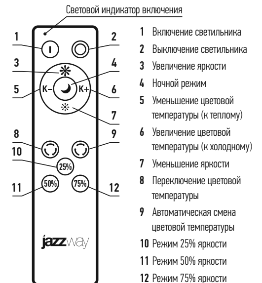
Пульт дистанционного управления (ДУ)