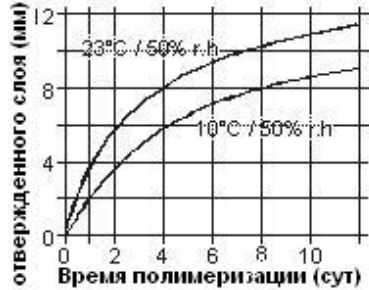
Диаграмма 1. Скорость полимеризации материала Sikaflex-265

Отверждение Sikaflex®-265 происходит под воздействием атмосферной влаги, которая диффундирует в клеевую массу. Содержание влаги в воздухе и скорость реакции отверждения зависят от температуры. При низкой температуре содержание влаги в воздухе снижается, что приводит к замедлению процесса (см. диаграмму).