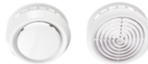
Диффузоры и анемостаты