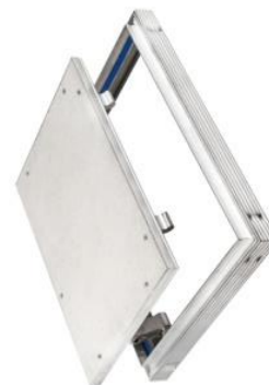
Люки под плитку и под покраску